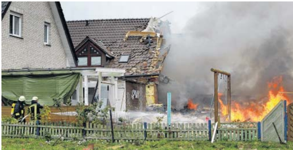
Löscharbeiten: Auf dem Nachbargrundstück brannte kurz nach der Explosion ein Gartenhaus nieder. Davon steht eine Schaukel, auf der sich zum Unglückszeitpunkt glücklicherweise keine Kinder befanden.

Dachpfannen und Glasscherben lagen in der angrenzenden Wiese bis zu hundert Meter weit verstreut. Auch rund ein Dutzend umliegende Häuser wurden durch die Ex-