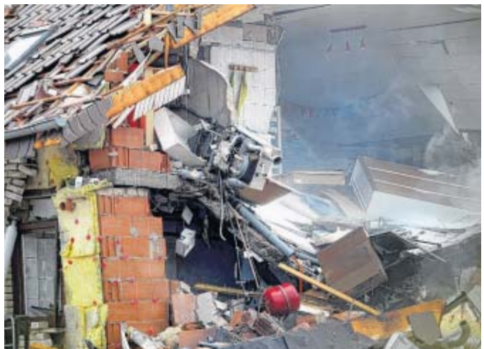
Völlige Zerstörung: Ein Ofen aus dem Badezimmer im ersten Stock ragt aus dem einsturzgefährdeten Gebäude heraus.