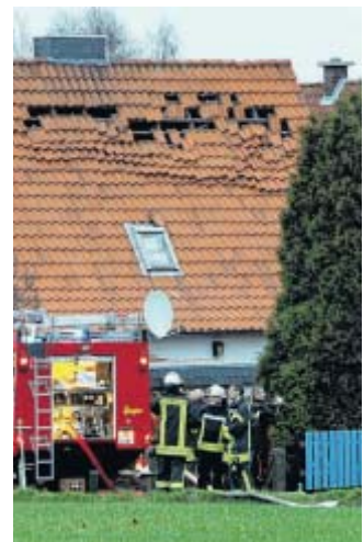
Lockere Dachziegel: Schaden an einem Nachbarwohnhaus.