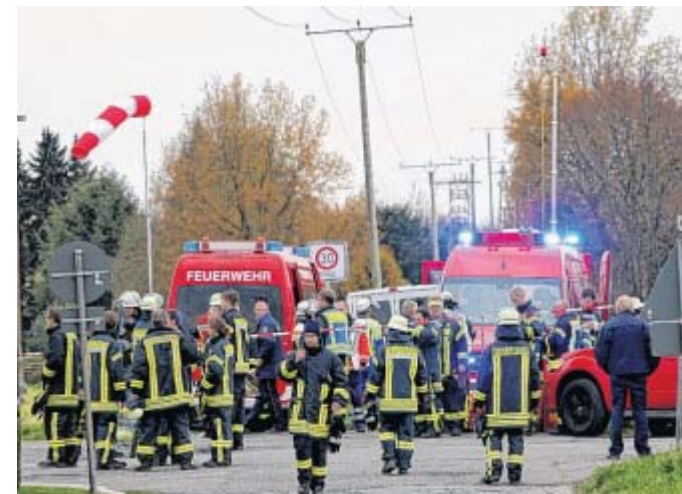
Großeinsatz: Rund 150 Einsatzkräfte von Feuerwehr, Rettungsdienst, Polizei, Energieversorger und Technischem Hilfswerk waren vor Ort.