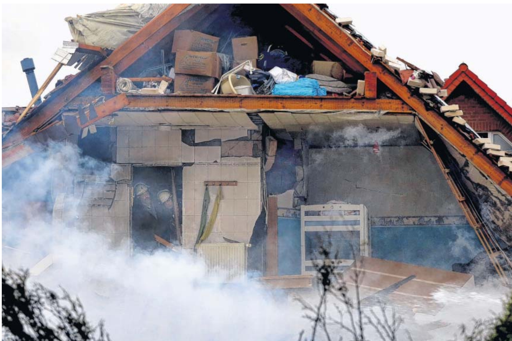
Ungewohnte Einblicke: Zwei Feuerwehrmänner stehen im Türrahmen eines zerstörten Wohnhauses im Bad Holzhausener Lerchenweg. Eine gewaltige Explosion hatte am Mittwochvormittag einen Teil des Gebäudes zerstört. Der 41-jährige Bewohner der Erdgeschosswohnung wird seitdem vermisst.