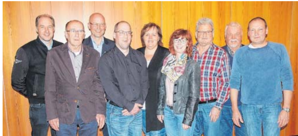
Engagiert für Nettelstedt: Der Vorstand der Dorfgemeinschaft.

Die nächsten Termine sind die Aktion Saubere Landschaft am Freitag, 31. März, Treffpunkt Sportzentrum am 17. Uhr. Am Donnerstag, 13. April, wird ab 17 Uhr Holz und Strauchwerk für das Osterfeuer an der Grundschule angenommen. Am Ostersonntag, 15. April, erfolgt um neun Uhr der Aufbau für das Osterfeuer um 17 Uhr. Am Ostersonntag, 16. April, beginnen ab neun Uhr die Abbauarbeiten. Am Samstag, 29. April, starten um 10 Uhr die Vorbereitungen für das Aufstellen des Maibaums. Das Fest fängt um 17 Uhr an der Scheune Siebeking an. Weitere Termine der Dorfgemeinschaft und Vereine www.nettelstedt.de